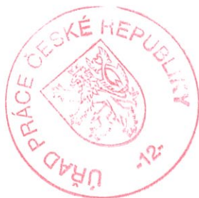
Mgr. Jan Karmazín, MPA ředitel Odboru zaměstnanosti

Podle ust. § 81 odst. 1 správního řádu, lze proti tomuto rozhodnutí podat odvolání k Ministerstvu práce a sociálních věcí, prostřednictvím Úřadu práce, u něhož se odvolání podává. Podle ust. § 83 odst. 1 správního řádu činí lhůta pro podání odvolání 15 dnů. Lhůta pro podání odvolání běží ode dne následujícího po doručení písemného vyhotovení rozhodnutí, nejpozději však po uplynutí desátého dne ode dne, kdy bylo nedoručené a uložené rozhodnutí připraveno k vyzvednutí.